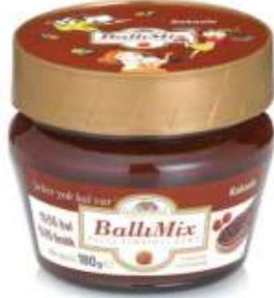
BallıMix Ballı Fıındıklı Kakaolu Ezme 180 g

Artık raflarda farklı bir lezzet var: Balparmak BallıMix. Ballı fıındıklı kakaolu ezme.