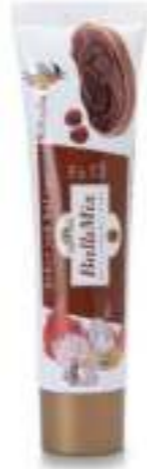
BallıMix Ballı Fıındıklı Kakaolu Ezme 40 g