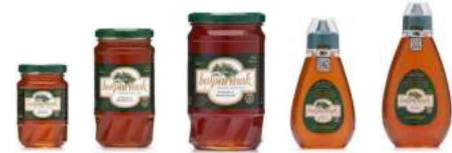
Balparmak Süzme Çam Balı 225 g