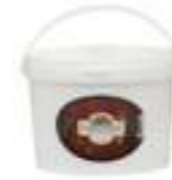
Balparmak Süzme Çiçek Balı 4 kg