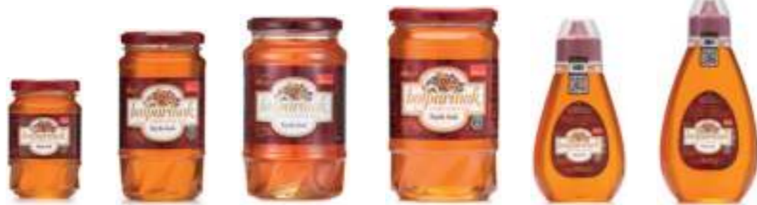
Balparmak Süzme Çiçek Balı 225 g