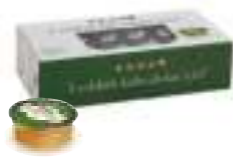
Balparmak Süzme Çam Balı Alüminyum 20 g x 72