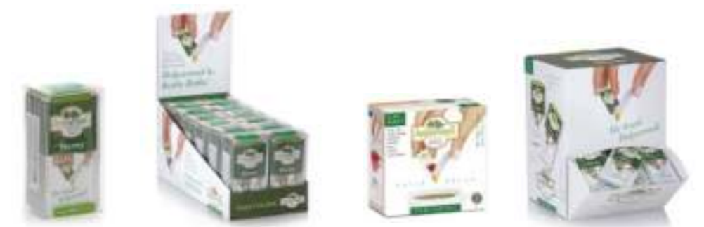
Balparmak Süzme Çam Balı 7 x 7 g