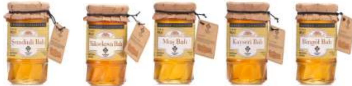
Balparmak Anadolu Lezzetleri Şemdinli Süzme Çiçek Balı 460 g