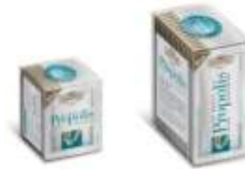
Balparmak Propolis Damla Çocuk 1.4 ml x 14