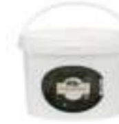
Balparmak Süzme Çam Balı 4 kg