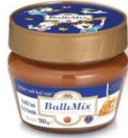
BallıMix Ballı Fıındıklı Ezme 180 g