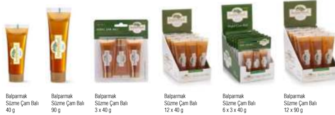
Balpamak Süzme Çam Balı 40 g