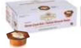
Balparmak Süzme Çiçek Balı 20 g x 120