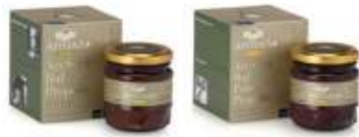
Balparmak Apitera+ Kids 210 g