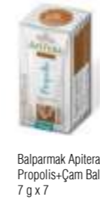
Balpamak Apitera Propolis+Çam Balı 7 g x 7