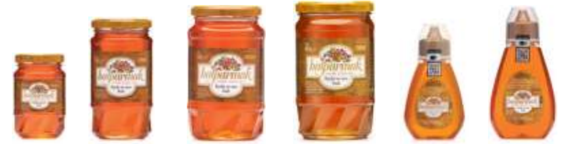
Balparmak Süzme Çiçek Balı 225 g