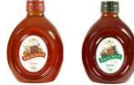
Balkovan Süzme Çiçek Balı 2 kg