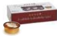
Balparmak Süzme Çiçek Balı Alüminyum 20 g x 72