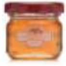
Balparmak Süzme Çiçek Balı 32 g x 24