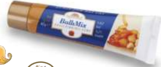
BallıMix Ballı Fıındıklı Ezme 40 g