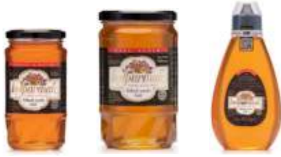
Balparmak Süzme Çiçek Balı 460 g