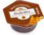
BallıMix Ballı Fıındıklı Kakaolu Ezme 15 g