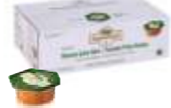
Balparmak Süzme Çam Balı 20 g x 120