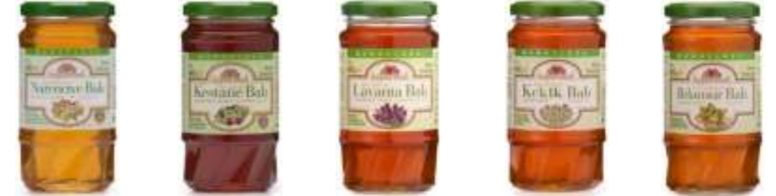
Balparmak Narenciye Balı 460 g