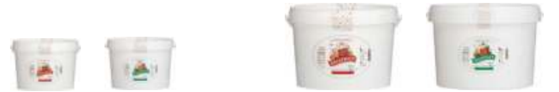
Balkovan Süzme Çiçek Balı 4 kg