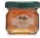
Balparmak Süzme Çam Balı 32 g x 24