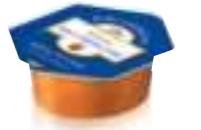
BallıMix Ballı Fıındıklı Ezme 15 g