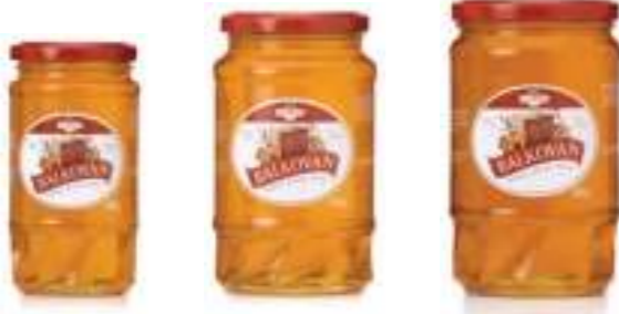
Balkovan Süzme Çiçek Balı 460 g