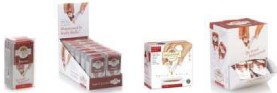
Balparmak Süzme Çiçek Balı 7 x 7 g