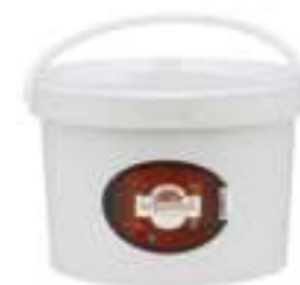
Balparmak Süzme Çiçek Balı 20 kg