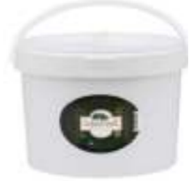
Balparmak Süzme Çam Balı 20 kg