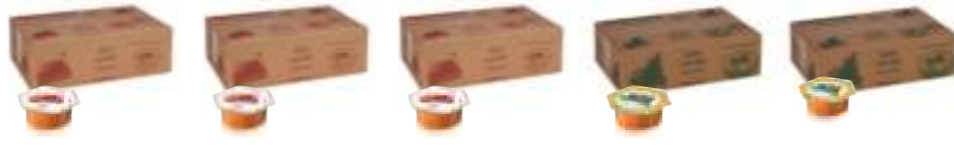
Balkovan Süzme Çiçek Balı 15 g x 120